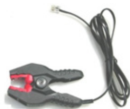
PINZA DE LECTURA

Sus IBees se pueden leer y programar con los softwares Thermotrack (PC, Online, Webservice) mediante la pinza de lectura y su adaptador USB