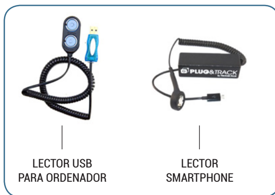
LECTOR USB PARA ORDENADOR